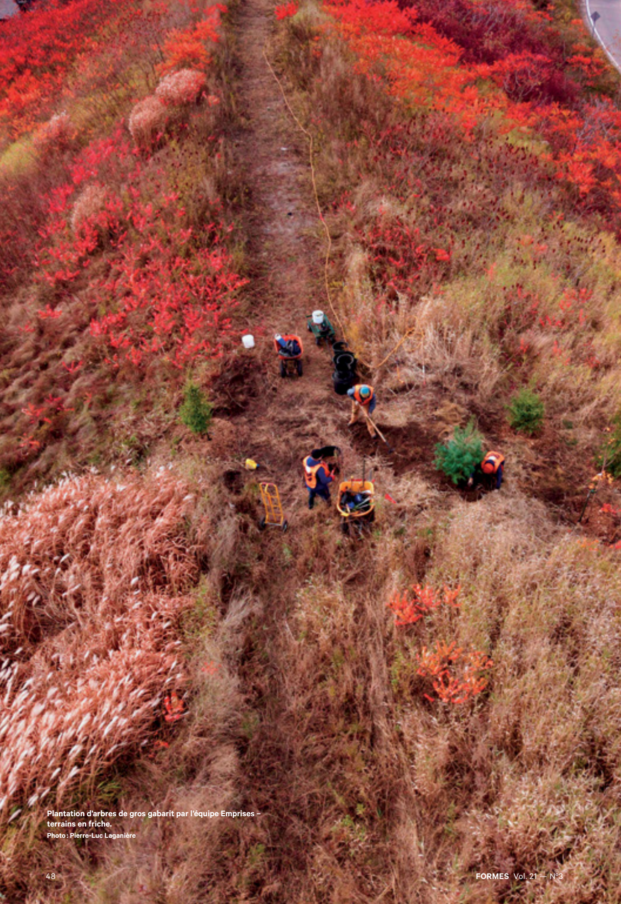
Plantation d'arbres de gros gabarit par l'équipe Emprises – terrains en friche.