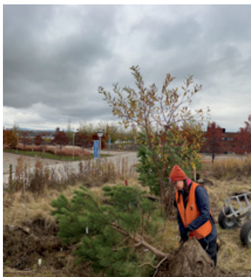
Plantation d'une haie protectrice par l'équipe Emprises / Baie de Beauport - 2025.

La FUS du Domaine Saint-Bernard est la première à avoir vu le jour au Québec. Constituée en 2000 par la municipalité de Mont-Tremblant , elle vise à protéger un terrain de 1500 acres du développement immobilier et à le rendre accessible à la population pour des activités récréatives, scientifiques et sociales 2 . La préparation de l'acte de fiducie demande un travail attentif et minutieux pour en déterminer les modalités, notamment le choix du fiduciaire et les règles de gestion.