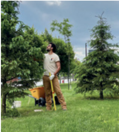
Entretien d'une mini forêt dense plantée par Emprises Espaces Urbains en 2023, à la frontière du quartier industriel de Limoilou.