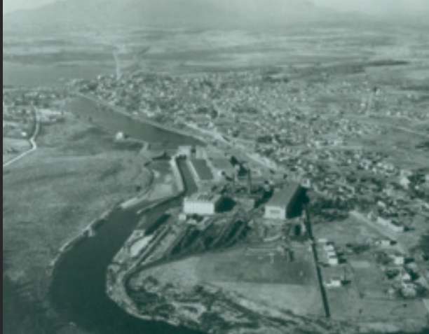
Vue aérienne du complexe textile et du barrage de la Dominion Textile vers 1929.